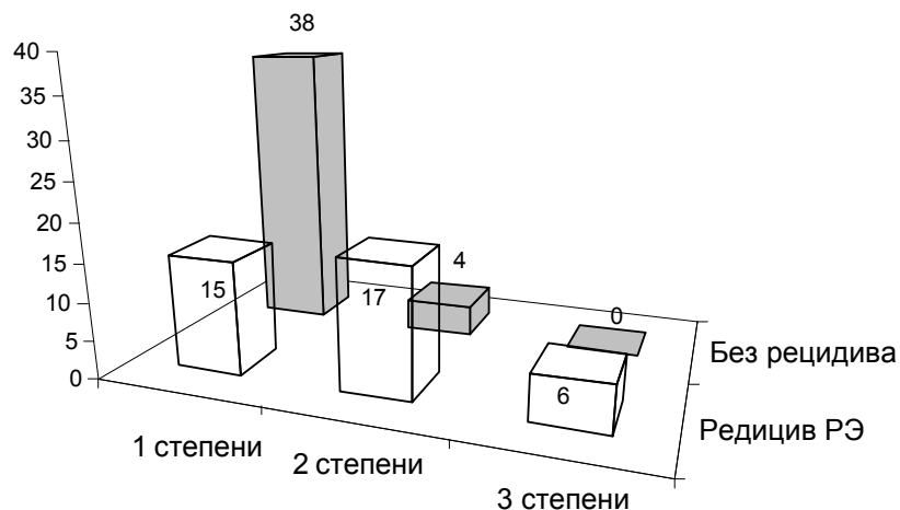
Рисунок 1 - Количество рецидивов РЭ на основании данных ФГДС

Поскольку нами использовались схемы не только с применением монотерапии при проспективном исследовании, оценены результаты лечения по количеству отдаленных рецидивов на основании клинических данных и данных инструментальных методов исследования (рис. 1).